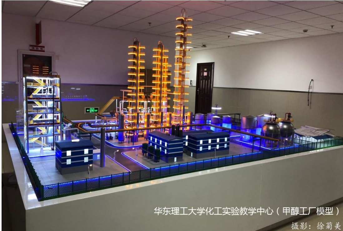
华东理工大学化工实验教学中心（甲醇工厂模型）