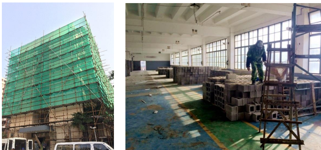
（图为工训外墙的脚手架和各层施工情况）（王瑞寅）