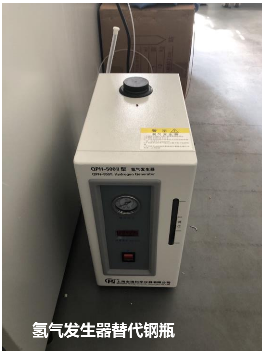
氢气发生器替代钢瓶

化工学院实验教学中心在暑期实验室改造中，采用氢气发生器替代了原有的氢气钢瓶，共计减少了 4 个氢气钢瓶。提升了实验室的本质安全水平。压缩气体管路不方便固定位置加装了管架，提升了固定效果。同时，对安全文化标识、安全设施、压缩气体管路等一并进行了改造。（徐宏勇）